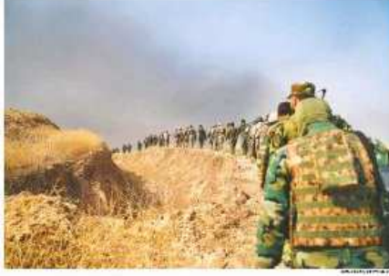
Kurdish peshmerga troops walk along a trench as they move to retake the village of Tabbana, northwest of Mosul. Iraq's Shiite counterterrorism units joined the drive against Islamic State militants and advanced to within 10 miles of the city. Meanwhile, a U.S. service member was reported killed in a bomb blast in Storck, Ala.